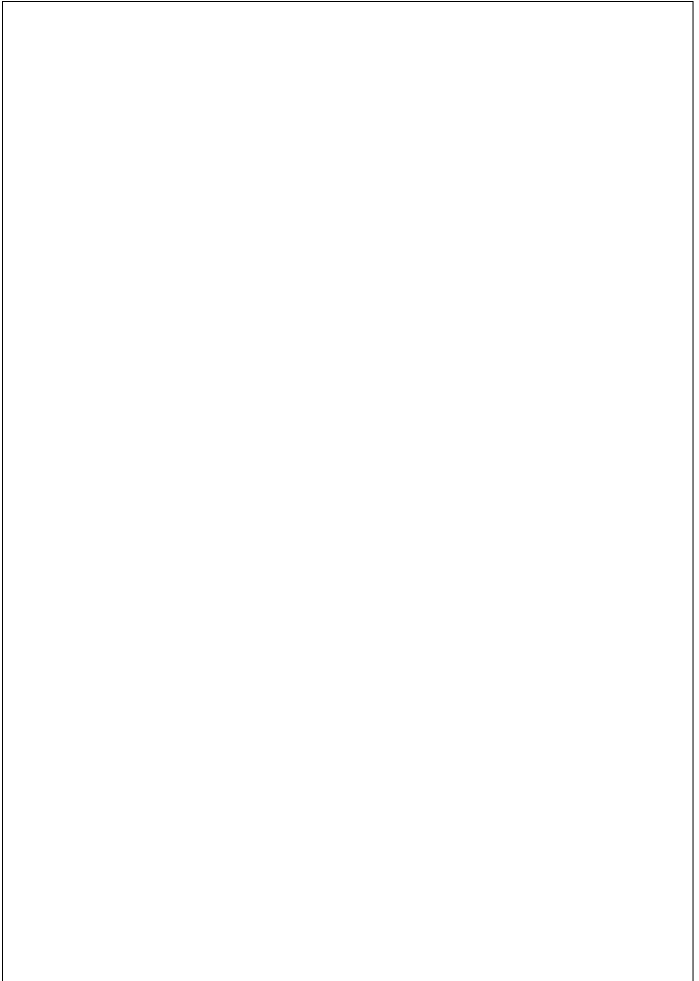
表32.資材採購單據黏貼處